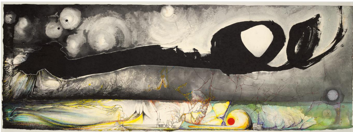
周綠雲，《宇宙之六》，年份不詳，紙本水墨及混合媒體，76 x 213 cm，私人藏品。