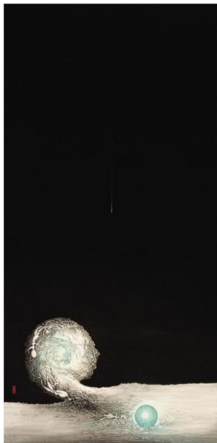
周綠雲，《我的內心世界 I》，1976，紙本 水墨設色，169.7 x 77.5 cm，香港藝術