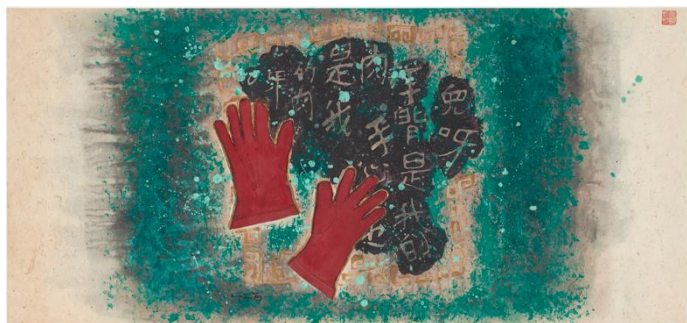
周綠雲，《手》，1960年代，混合媒介，57 x 119 cm，私人藏品。